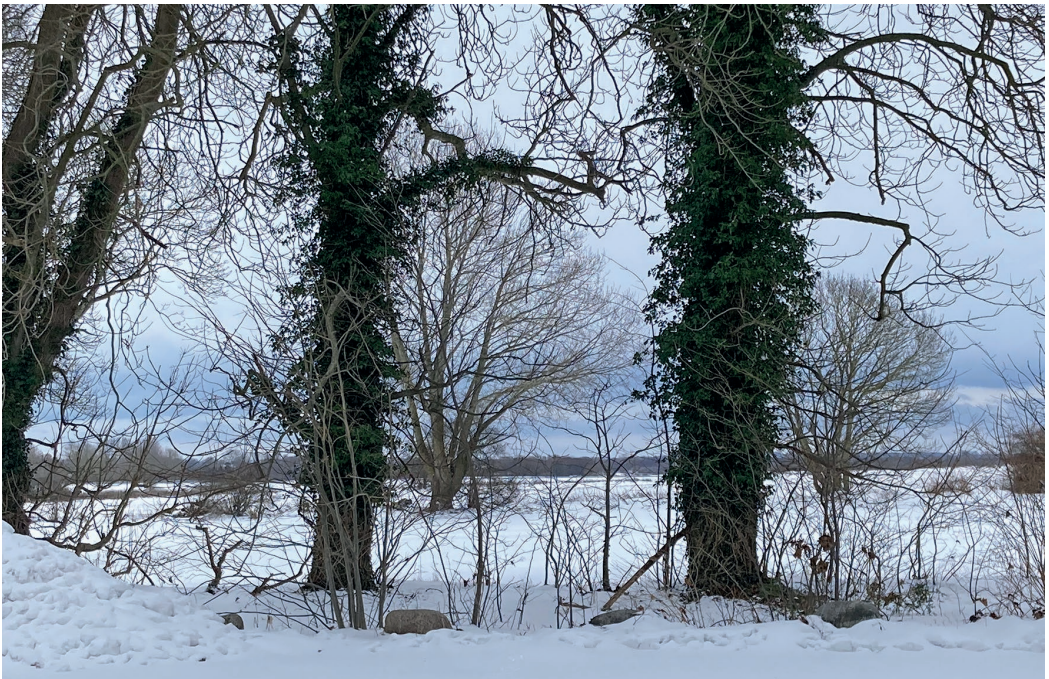
Kyndelsmisse, hvor sneen ligger som et smukt lag omkring Skellerup Præstegård.