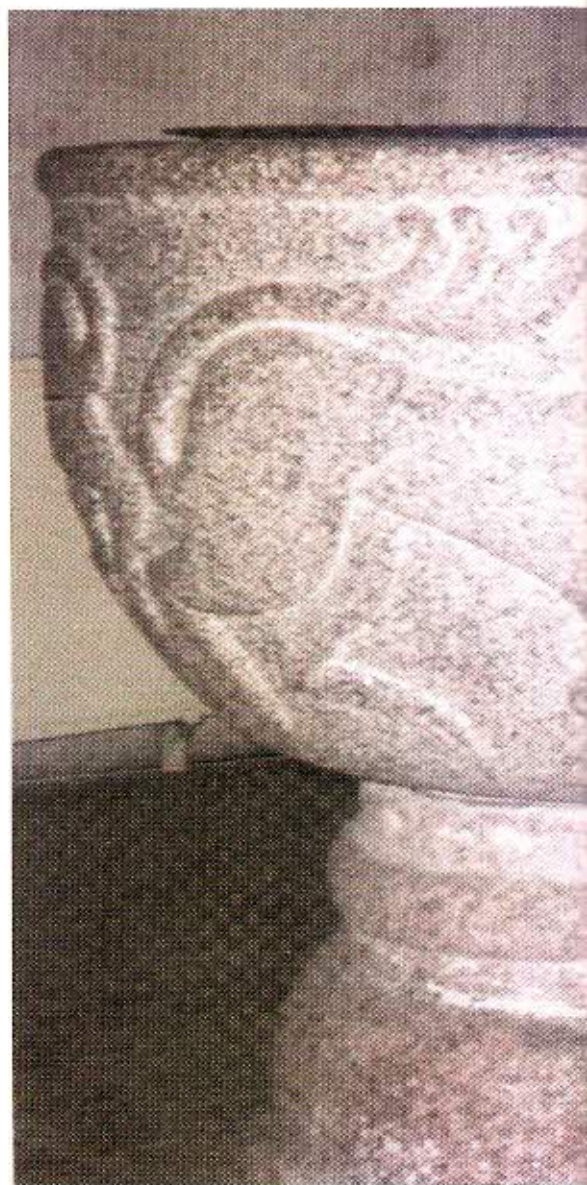
Dåben findes overalt i de kristne kirker, selv om dåben symboliserer renselse, død og genfødsel. Hæng er, at den sker i Jesus navn. Barnedåben blev først brugt omkring år 200.

Løven og kampen hørte sammen fra gammel tid. Allerede længe før kristendommens tid gav man løven denne betydning. Og i Bibelen tales der mange steder om løver i forbindelse