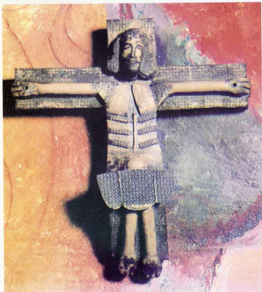
Niels Helledie: Opstandelseskrucifiks, 1987.