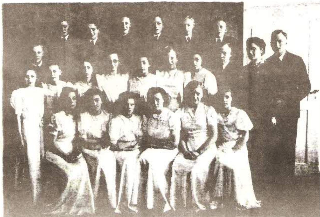
A propos besøget og denne konfirmationstid