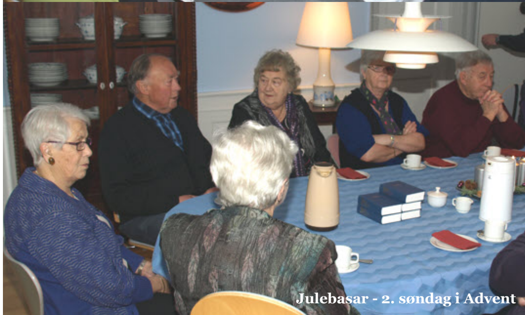
Julebasar - 2. søndag i Advent