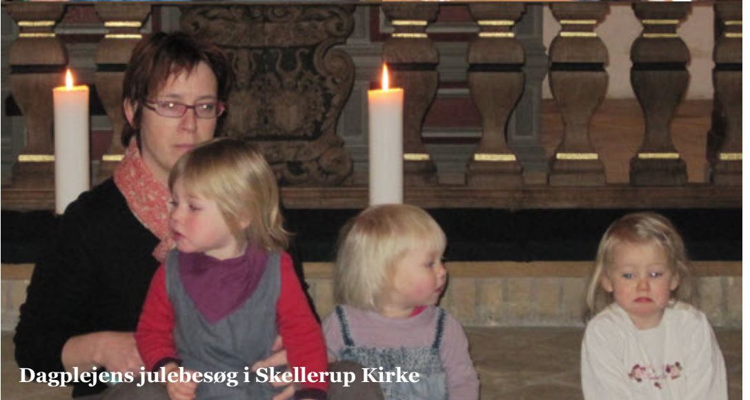
Dagplejens julebesøg i Skellerup Kirke